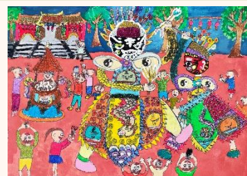
六甲 周利承 八家將