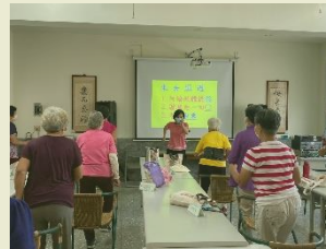
教導學員如何吃得更健康，大家一起筋骨動一動，一起樂開懷。