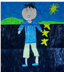
一甲 蔡易達 我的自畫