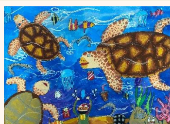
五乙 李嘉芊 大海·不「塑」我的家