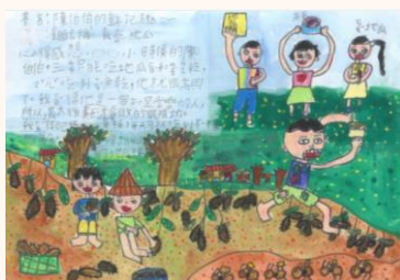
三乙 周昕渝 我愛地瓜