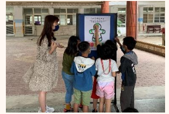
性別平等暨性侵害防治宣導