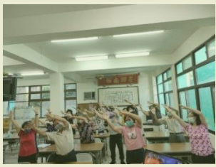
大家一起歡唱曲，一起擺動身軀，享受快樂的樂齡生活。