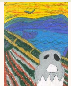
四乙 劉承龍 吶喊1020