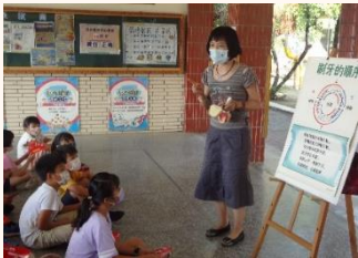
視力、口腔衛教宣導