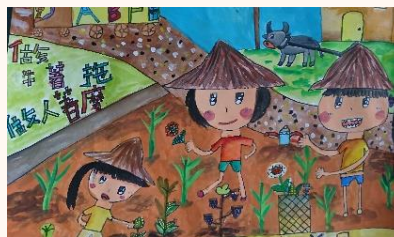
四甲 張倍熏 母語日做牛著拖做人著磨