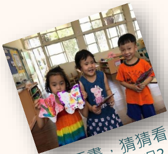
扇子水拓畫，猜猜看我們是怎麼做的呢？