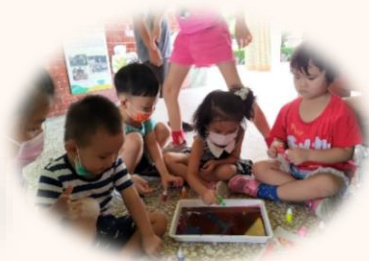
利用顏料調色之後，大家來進行水拓畫的創作吧。