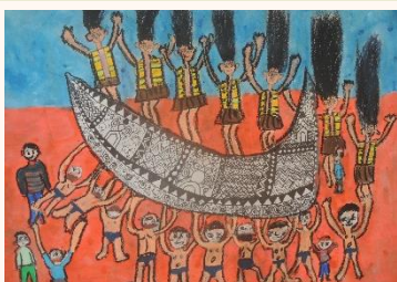
五甲 施俊宇 達悟拼板舟