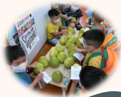
來幫柚子貼上數字牌排排隊。