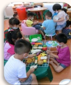
寶貝們扮演烤肉的樣子比家長還厲害。