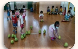
來玩柚子保齡球遊戲，看看誰的分數最高。