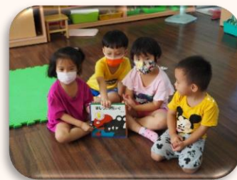
這是我們大家票選出來最喜歡的繪本-「鱷魚怕怕 牙醫怕怕」。