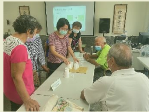
跟樂齡長輩一起腦力激盪，一起遊戲一起討論。