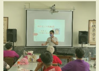
樂齡學習重要性，志工成長在職訓練，大家一起走出來。