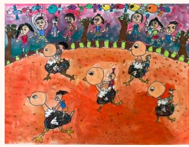
二甲 柯怡晴 騎駝鳥比賽真快樂